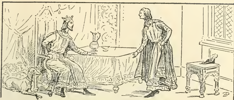
Thomas se mit à sourire... (page 236)